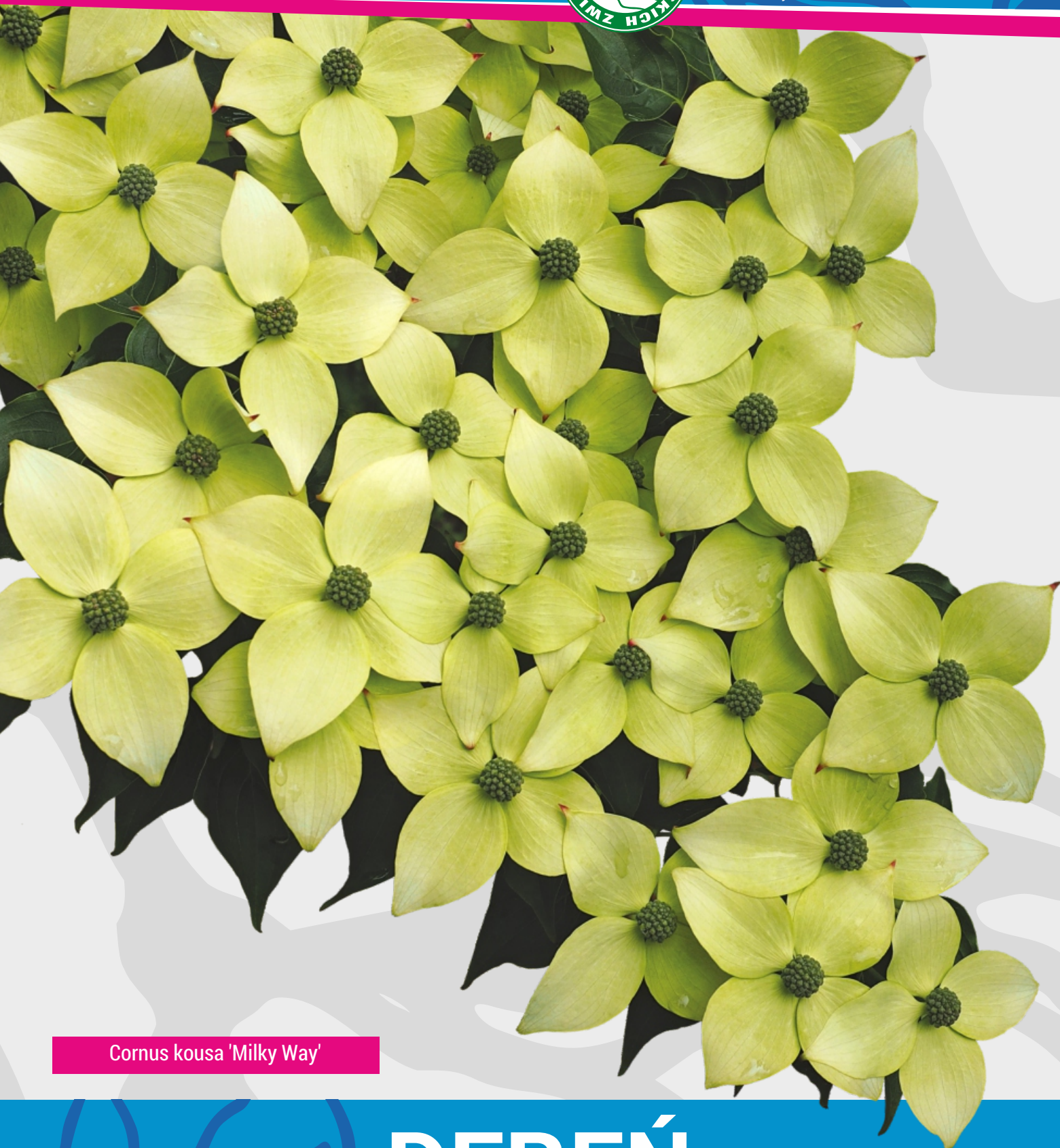
Cornus kousa 'Milky Way'