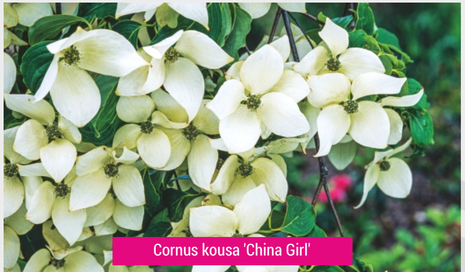
Cornus kousa 'China Girl'