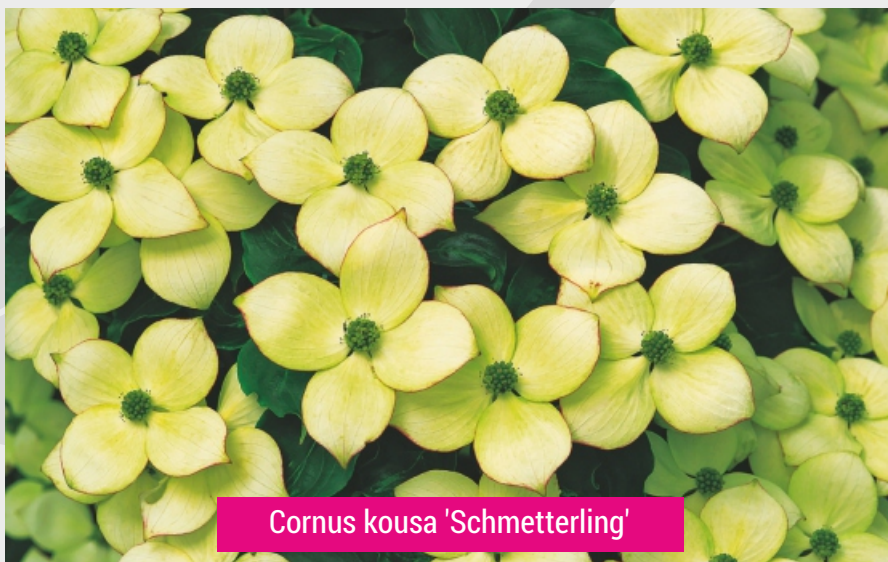
Cornus kousa 'Schmetterling'