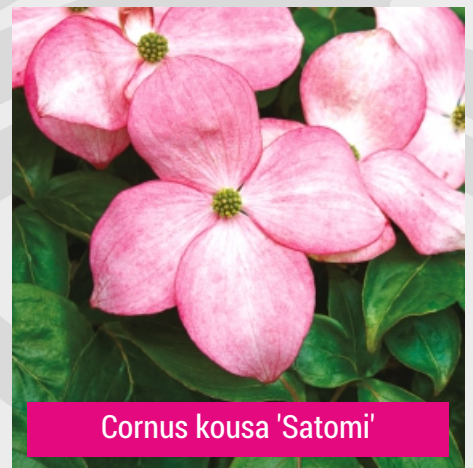
Cornus kousa 'Satomi'