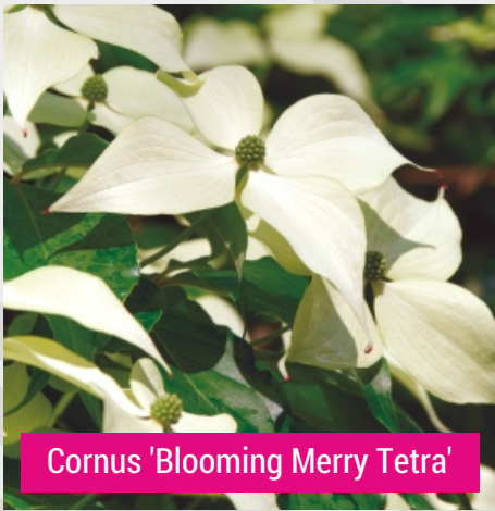
Cornus 'Blooming Merry Tetra'