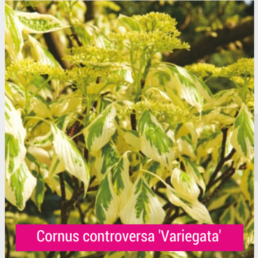
Cornus controversa 'Variegata'