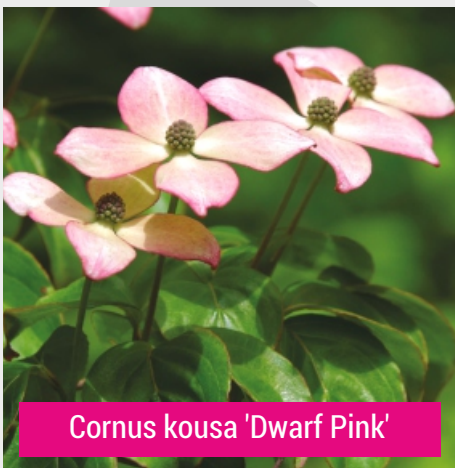
Cornus kousa 'Dwarf Pink'