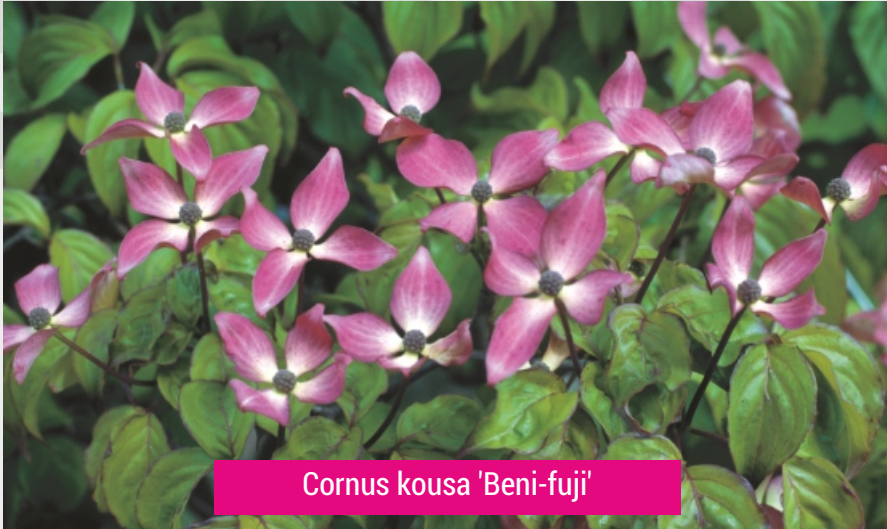
Cornus kousa 'Beni-fuji'