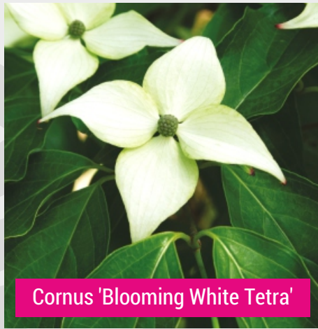
Cornus 'Blooming White Tetra'