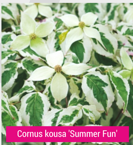
Cornus kousa 'Summer Fun'