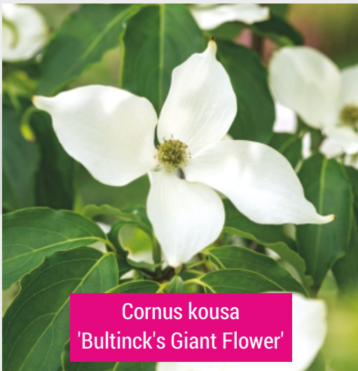
Cornus kousa 'Bultinck's Giant Flower'