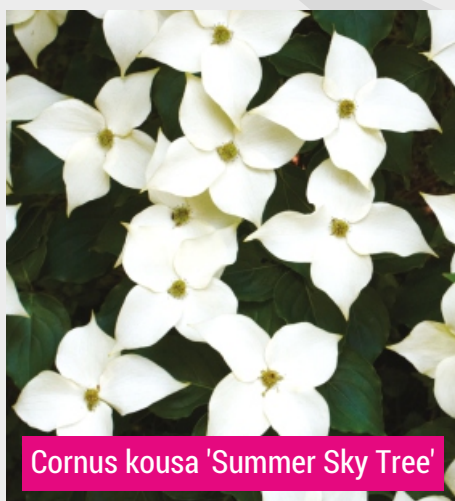
Cornus kousa 'Summer Sky Tree'