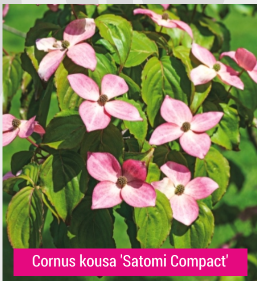
Cornus kousa 'Satomi Compact'