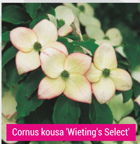
Cornus kousa 'Wieting's Select'