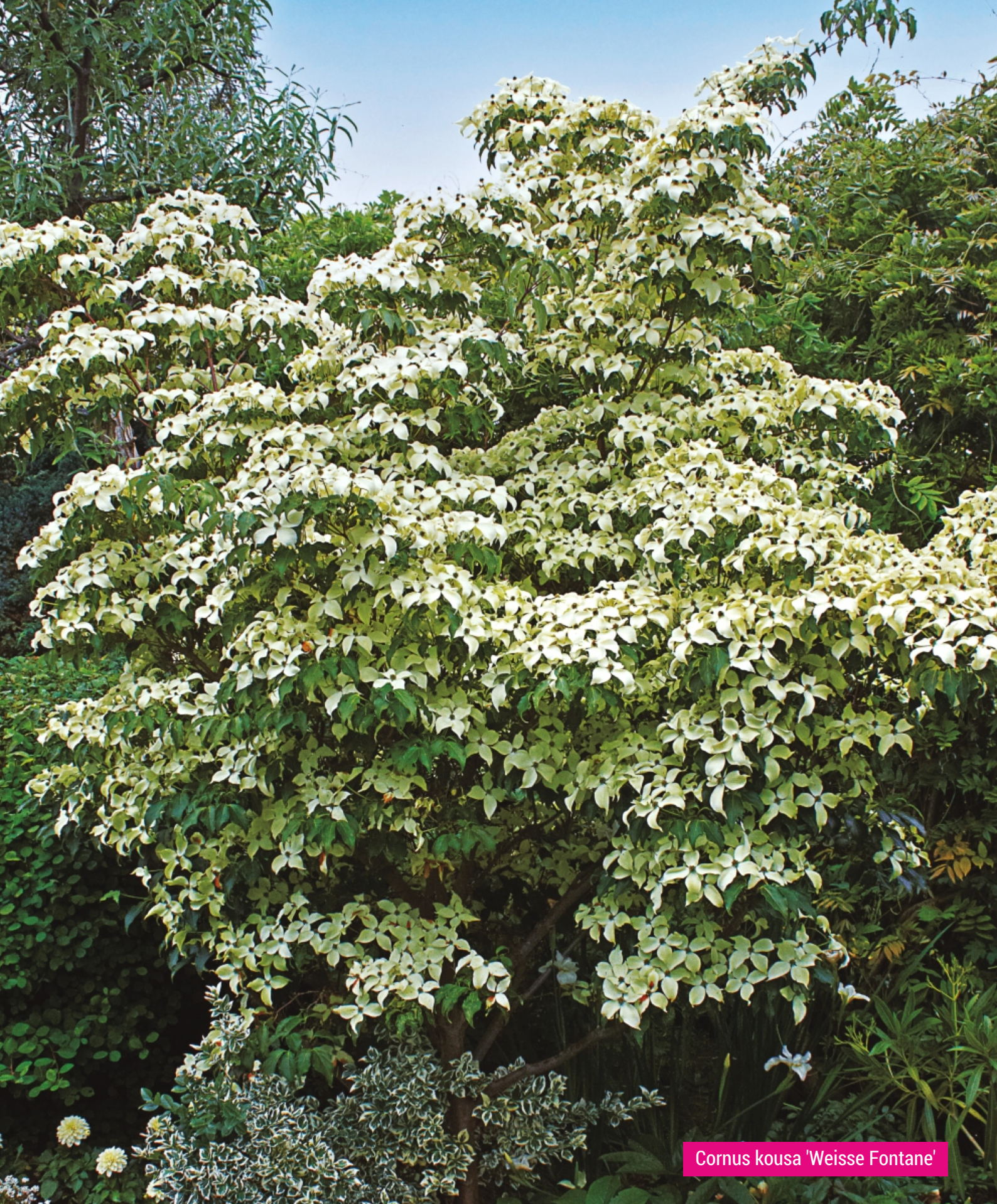
Cornus kousa 'Weisse Fontane'