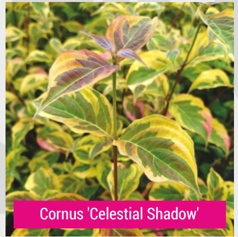
Cornus 'Celestial Shadow'