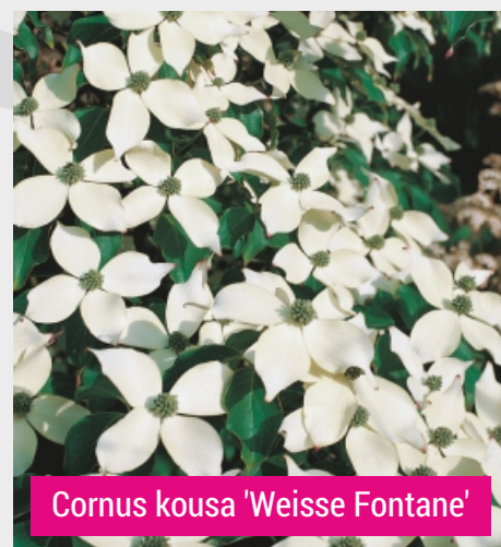
Cornus kousa 'Weisse Fontane'